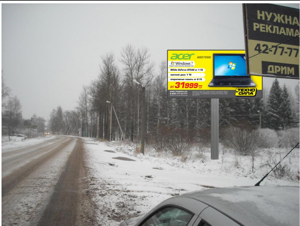
Сторона А (по ходу движения)