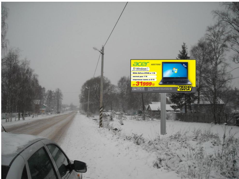
Сторона А (по ходу движения)