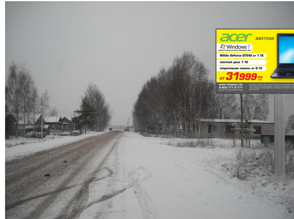
Сторона Б (против хода движения)