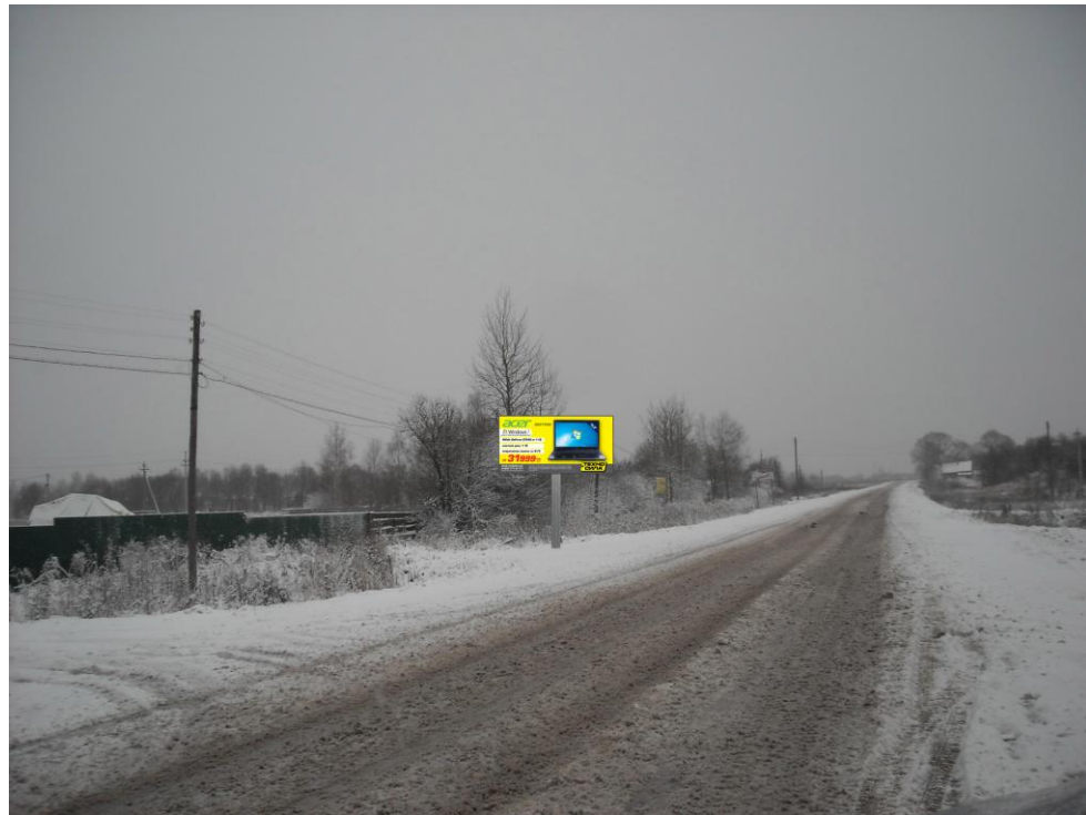
Сторона А (по ходу движения)