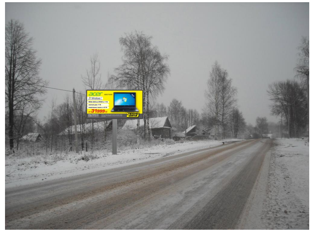
Сторона Б (против хода движения)