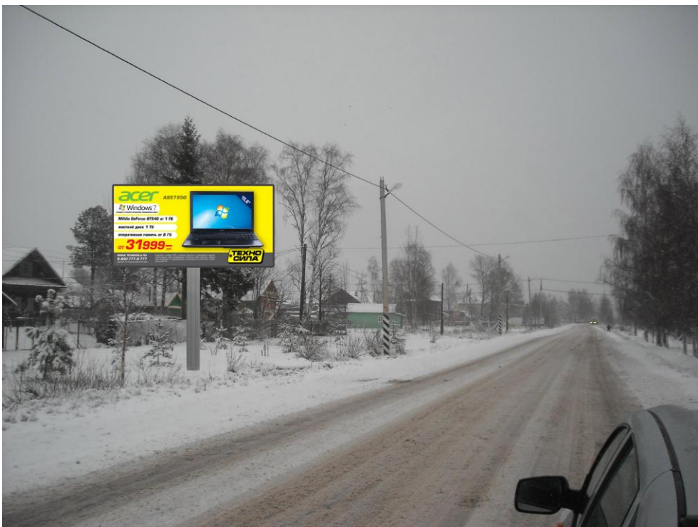
Сторона Б (против хода движения)