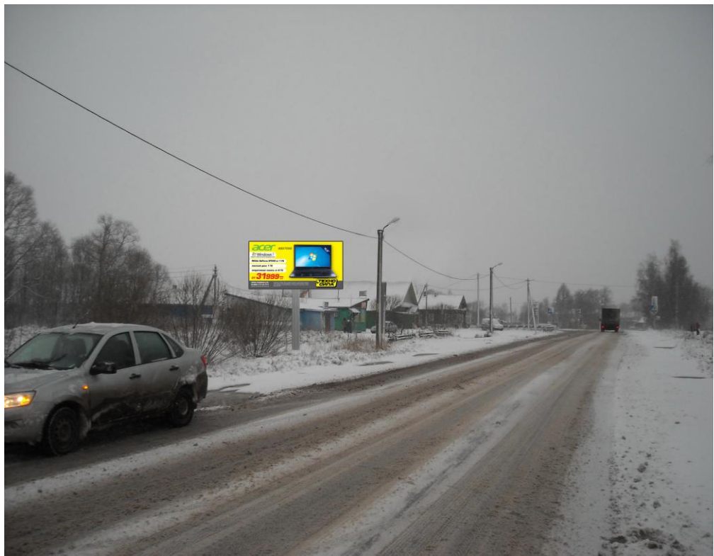
Сторона Б (против хода движения)