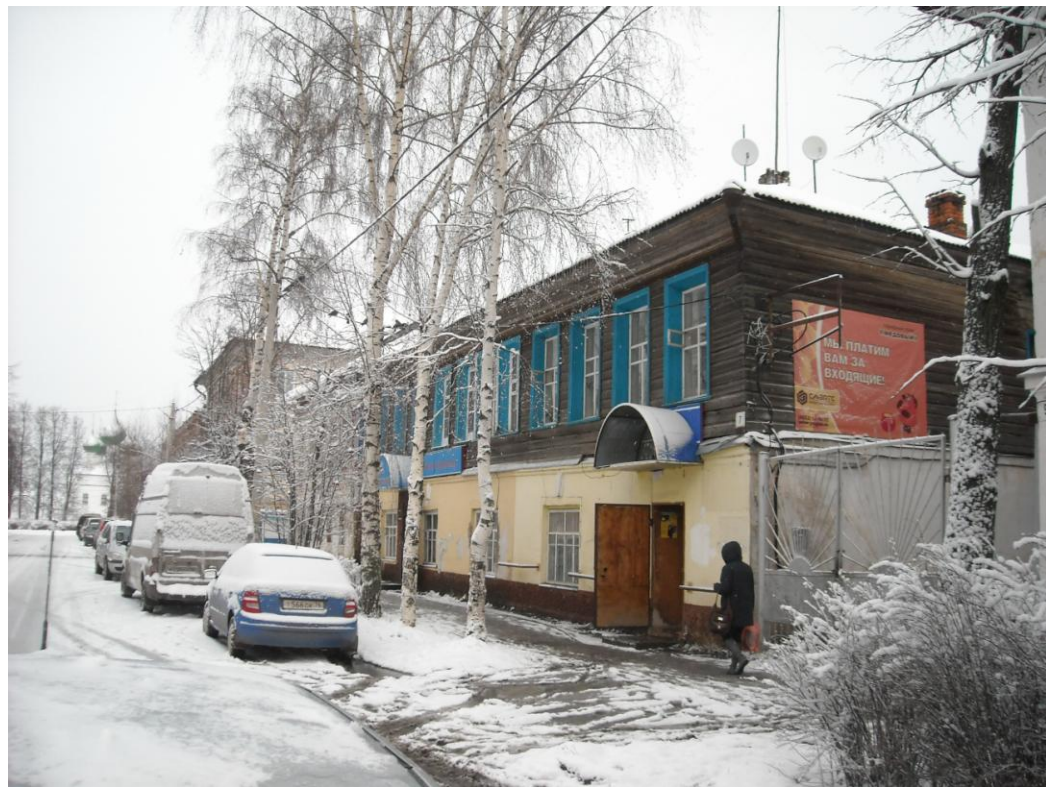
Сторона А (по ходу движения)