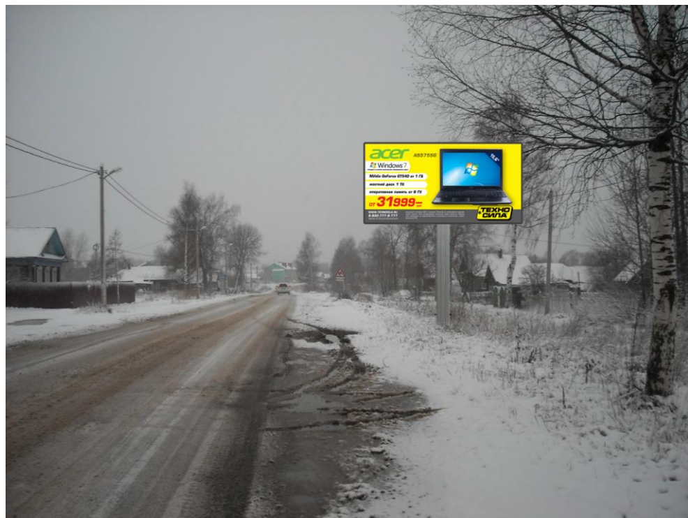
Сторона А (по ходу движения)