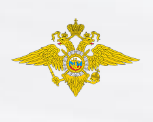
Министерство внутренних дел Российской Федерации