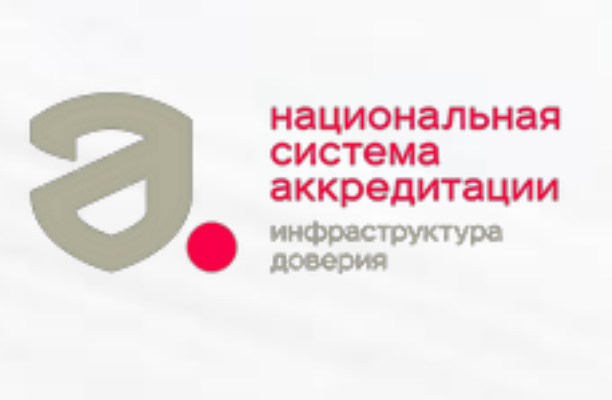
Национальная система аккредитации