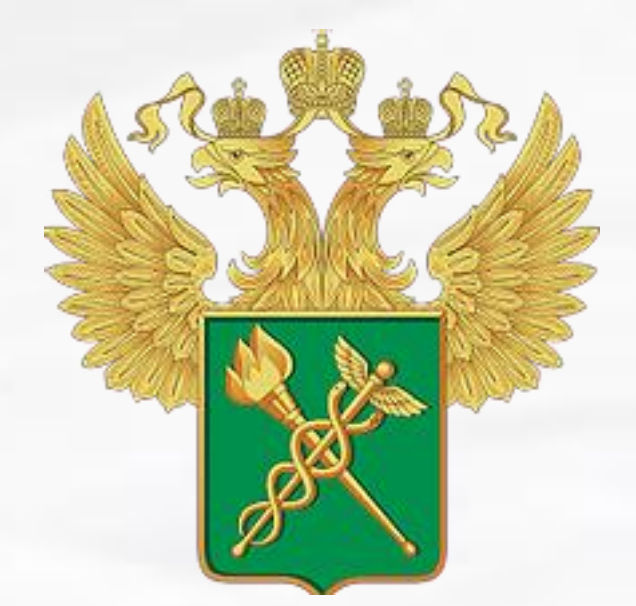
Федеральная таможенная служба Российской Федерации

Горячая линия «Антиконтрафакт» не подменяет, предусмотренные законодательством Российской Федерации, каналы общения органов власти с гражданами и организациями по вопросам противодействия незаконному обороту промышленной продукции.