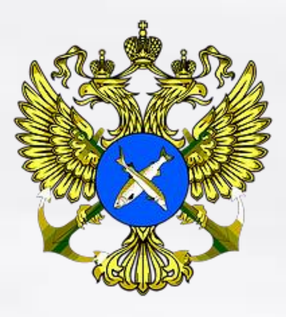
Федеральное агентство по рыболовству