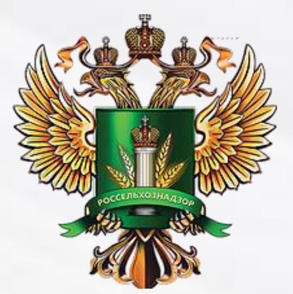
Федеральная служба по ветеринарному и фитосанитарному надзору/ Россельхознадзор