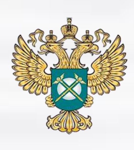
Федеральная антимонопольная служба России

Федеральное агентство по управлению государственным имуществом