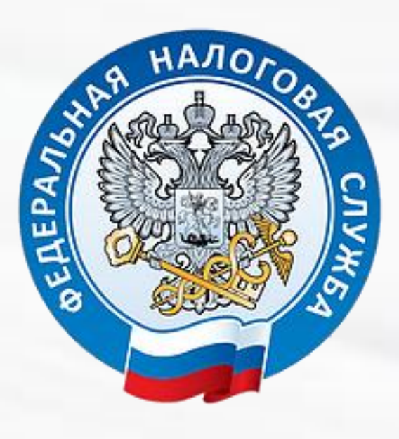
Федеральная налоговая служба РФ