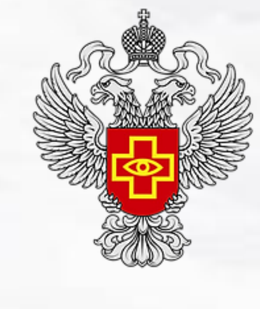
Федеральная служба по надзору в сфере здравоохранения