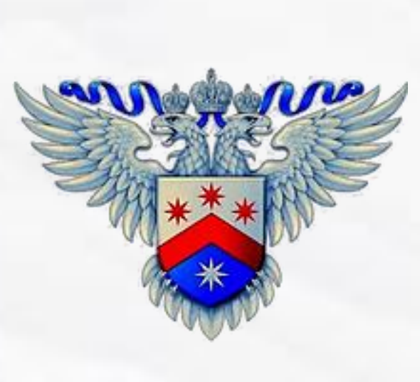
Федеральная служба по интеллектуальной собственности