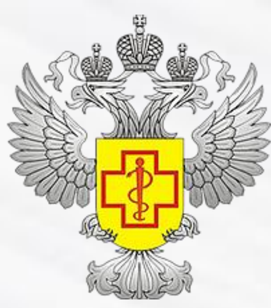
Федеральная служба по защите в сфере прав потребителей и благополучия человека