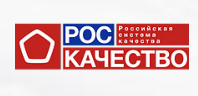
Автономная некоммерческая организация «Российская система качества»/ РОСКАЧЕСТВО