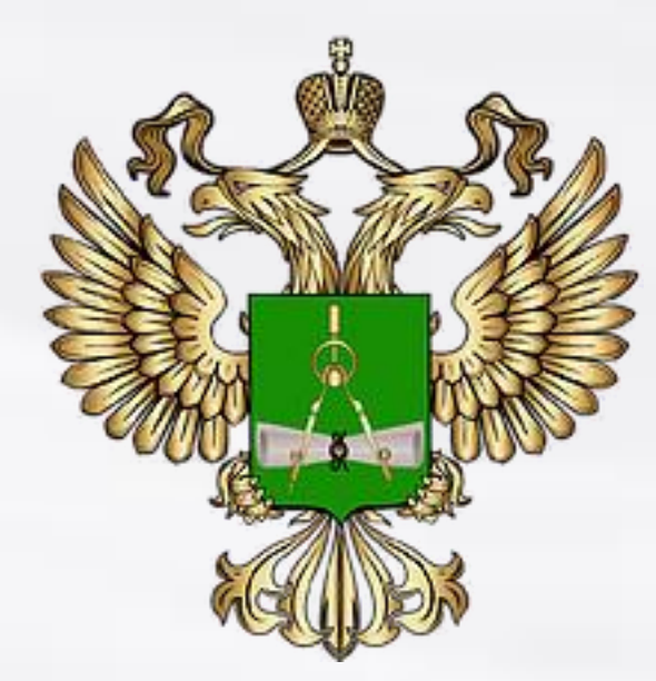
Федеральное агентство по техническому регулированию и метрологии - Росстандарт